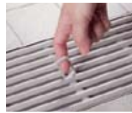
④便利な取っ手付き。