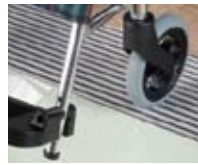
③車イスやストレッチャーなど重量物もスムーズ。