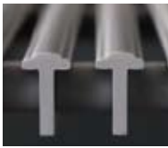
①上面はやわらかい軟質樹脂を使用。