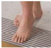
②すき間は6ミリ以下。指が入らず安全で素足にやさしい。