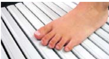
上面がやわらかい軟質樹脂のため、水に濡れても滑りにくく安全です。また、グレーチングのすき間が6ミリ以下なのでお子様の指も入らず安全です。