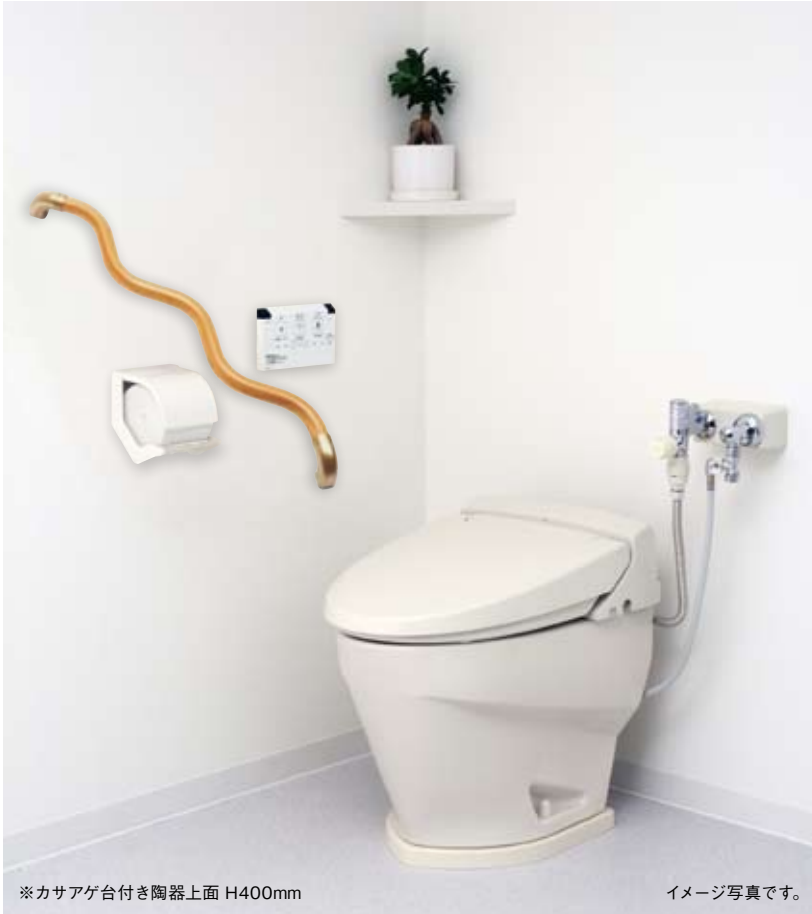
※カサアゲ台付き陶器上面 H400mm

身体の不自由な方、高齢者の方を対象に、 使う人の視点から安全性と機能性を考えたトイレです。