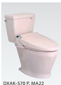
DXAK-570 P, MA22