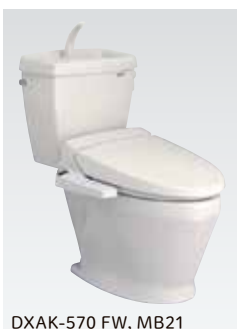
DXAK-570 FW, MB21