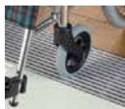
③車イスやストレッチャーなど重量物もスムーズ