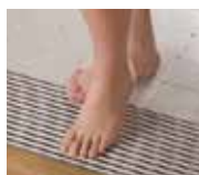
②すき間は6ミリ以下。指が入らず安全で素足にやさしい