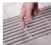
④便利な取っ手付き