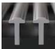
①上面はやわらかい軟質樹脂を使用