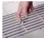
④便利な取っ手付き