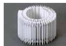
軽量で巻き取り収納が可能なためメンテナンスや清掃が容易です。

用途・お好みに合わせて4色から選択できます。 ※ジョイントのカラーはライトグレーのみ。