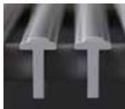
①上面はやわらかい軟質樹脂を使用