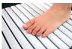
上面がやわらかい軟質樹脂のため、水に濡れても滑りにくく安全です。また、グレーチングのすき間が6ミリ以下なのでお子様の指も入らず安全です。