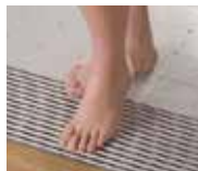
②すき間は6ミリ以下。指が入らず安全で素足にやさしい