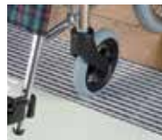
③車イスやストレッチャーなど重量物もスムーズ